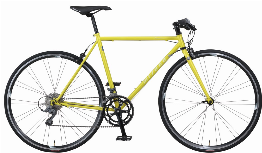
レモンライムイエロー (0Y91) 【フレームサイズ：480mm/520mm】

株式会社ミヤタサイクル（本社：神奈川県川崎市、代表取締役：高谷 信一郎）は、人気のクロモリフレームにシマノ製コンポーネントを搭載した、スタイリッシュなフラットバー・ロードバイク「フリーダム フラット」を、2015年11月20日に全国のミヤタ販売店を通じて新発売します。