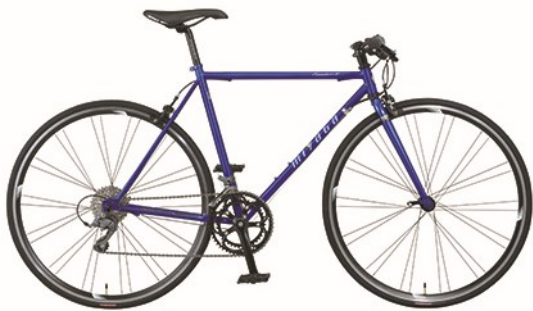
クリアブルー (0B19) 【フレームサイズ : 520mm】