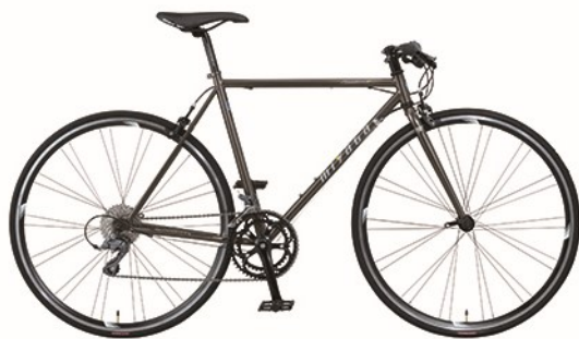
カーボングレーメタリック (0S65) 【フレームサイズ : 520mm】