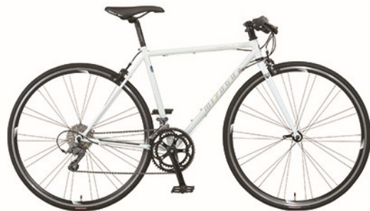
シャイニーパールホワイト (0W40) 【フレームサイズ : 480mm】