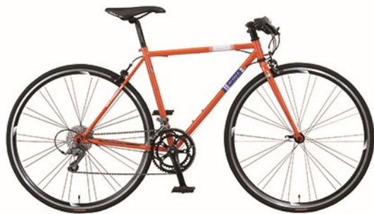
オレンジムーン (0Y82) 【フレームサイズ : 480mm】