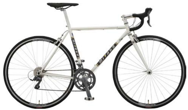
シャイニーパールホワイト (OW40)